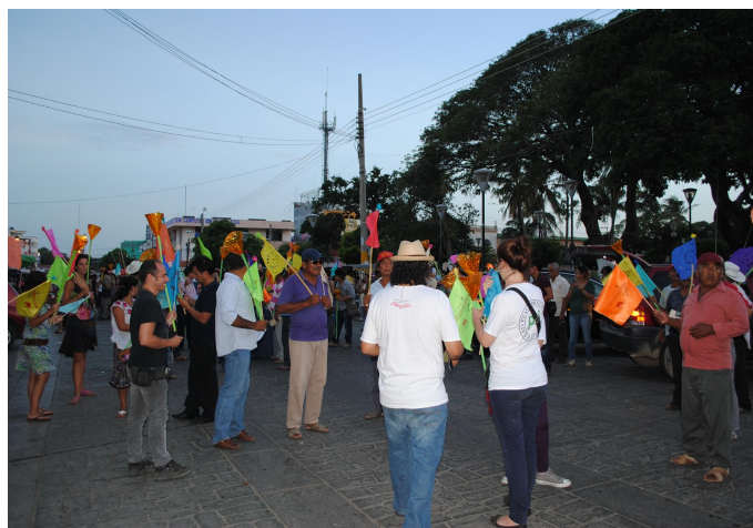
Voluntaria de PBI con un miembro de EDUCA durante la "calenda por la vida" en el Istmo de Tehuantepec

Diariamente EDUCA publica noticias en su "Minuta" y transmite de su radio "Espejos". Trimestralmente publican un boletín de análisis y reflexión, "El Topil", además de campañas de información y muchas otras publicaciones, como libros, diagnósticos etc. Hace algunos meses han lanzado la campaña "Defendiendo Derechos Sembramos Futuro" para visibilizar el trabajo de defensoras y defensores comunitarios.