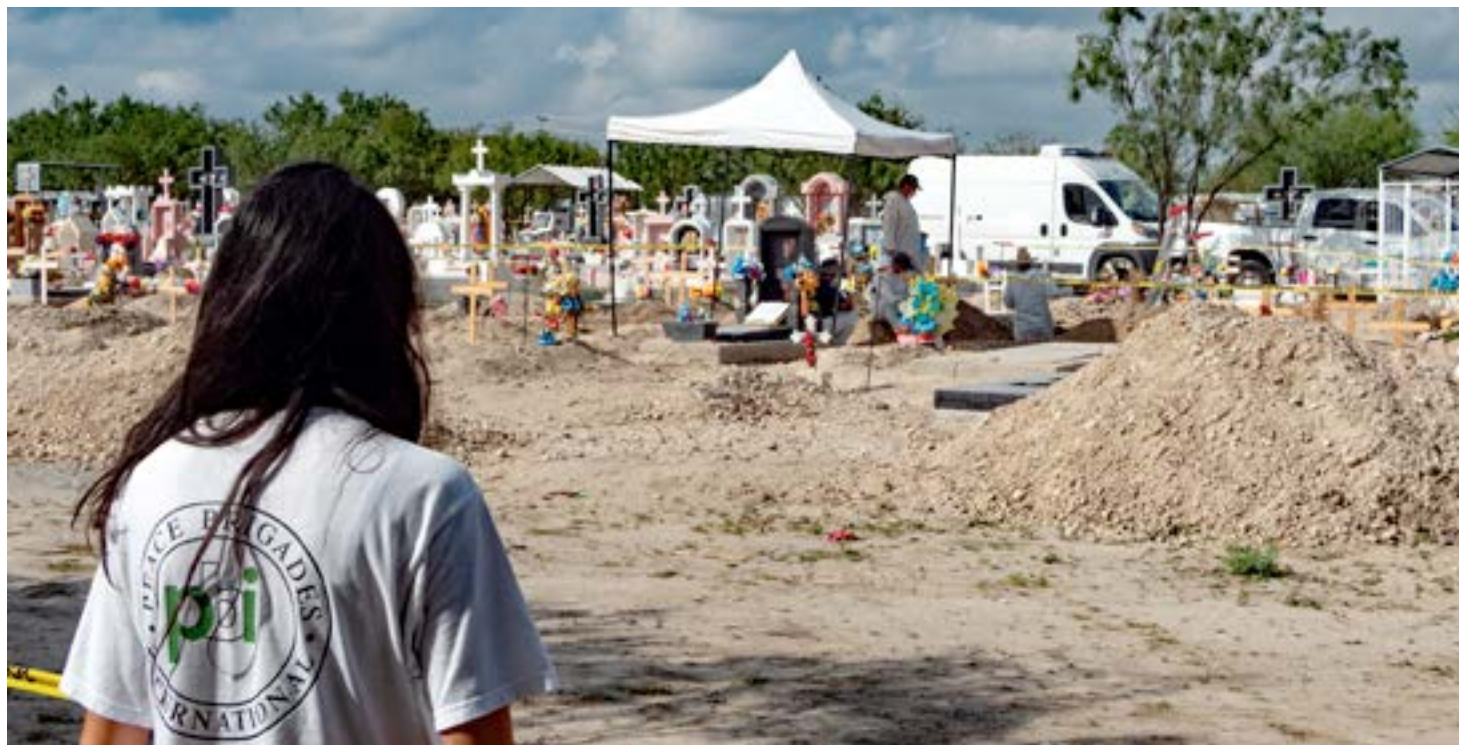
Foto: Acompañamiento en jornadas de exhumaciones, Coahuila, 2019

El Centro Diocesano Fray Juan de Larios (FJDL), es una de las organizaciones que acompaña el Plan Estatal de Exhumaciones (PEE) en Coahuila y representa a colectivos de familiares de víctimas de desaparición. A petición de esta organización que acompañamos desde 2014, PBI tiene un rol de observador internacional desde que el PEE se puso en marcha desde finales de 2017. A su vez, PBI acompaña las jornadas de exhumaciones que cada determinado tiempo se dan en diferentes puntos de la geografía coahuilense, así como a las Mesas de Coordinación Forenses (MCF) donde se da seguimiento a todo aquello que acontece respecto del Plan.