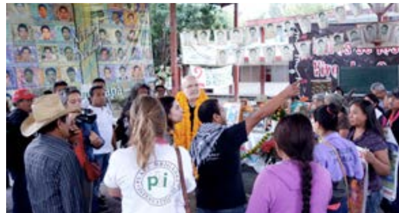
Foto: Acompañamiento al Centro de derechos humanos la Montaña Tlachinollan en el marco de una visita del Relator Especial de la ONU sobre la situación de personas defensoras de derechos humanos Michel Forst, Tlapa de Comonfort, 2017

Tampoco olvidamos que fueron ex voluntarias y voluntarios de PBI quienes abrieron el área internacional de Tlachinollan. PBI tiene un papel importante para nosotros en cuanto a la lucha para la justicia y la verdad, pero también en el sentirse una familia.