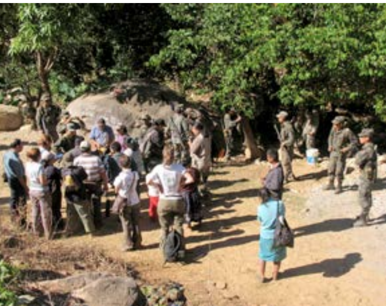
Foto: Acompañamiento a la comunidad de Ayutla de los Libres, Guerrero, 2009

res en el Instituto Nacional Indigenista (INI), actualmente Instituto Nacional de los Pueblos Indígenas (INPI).