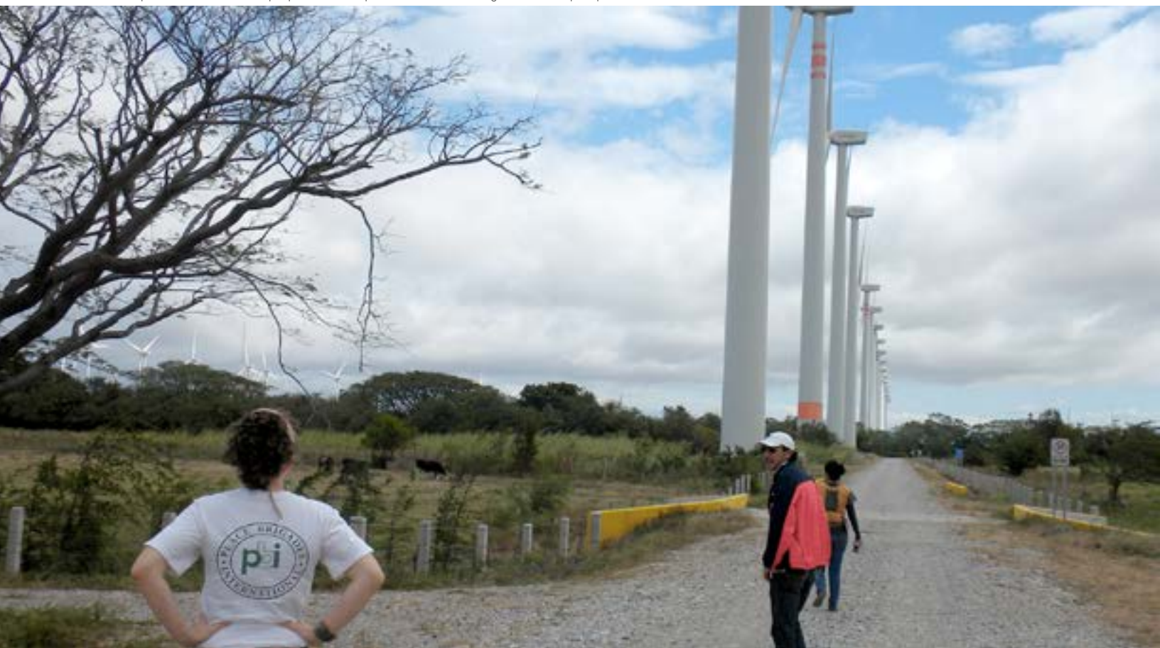
Foto: Acompañamiento a una visita de parques eólicos con personas defensoras e integrantes del Cuerpo Diplomático, Oaxaca, 2013