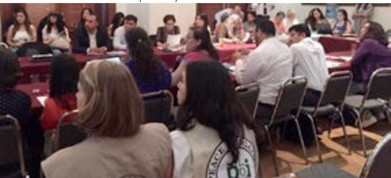
Foto: Integrantes del equipo Norte observando mesas de revisión del Plan de Contingencia para personas defensoras de derechos humanos, Chihuahua, 2019

CIUDAD DE MÉXICO: Comité Cerezo México; Espacio_OSC para la Protección de Personas Defensoras y Periodistas; Grupo Focal sobre Empresas y Derechos Humanos