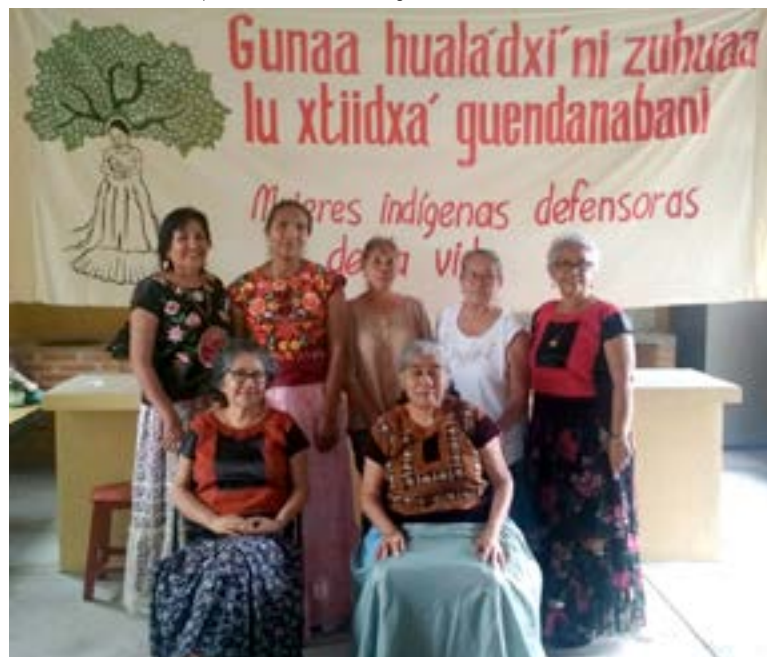
Foto: Defensoras de la tierra y el territorio de Unión Hidalgo, Oaxaca, 2019

Los comuneros ya conocen los impactos de los parques eólicos. En 2004, propietarios particulares firmaron contratos de arrendamiento de tierra con la empresa DEMEX y ahí empezó la construcción del primer parque eólico en Unión Hidalgo, “Piedra Larga Fase I” y Piedra Larga Fase II 47 . Según las personas defensoras, la firma de estos contratos y la siguiente construcción fueron realizadas sin respetar el carácter comunal de la tierra, y sin una consulta previa, libre e informada. También resaltaron que los pobladores no recibieron información en su lengua nativa (Zapotec), ni recibieron información sobre los impactos sociales, ambientales o económicos que el proyecto traería, por lo que la oposición a los proyectos no se hizo esperar y en medio de agresiones y desalojos de la Policía Estatal, DEMEX logró imponerse.