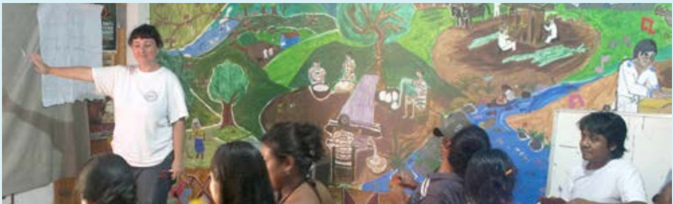
Foto: Carla Cavarretta impartiendo un taller de seguridad con integrantes de la Radio Ñomnda, Guerrero, 2011